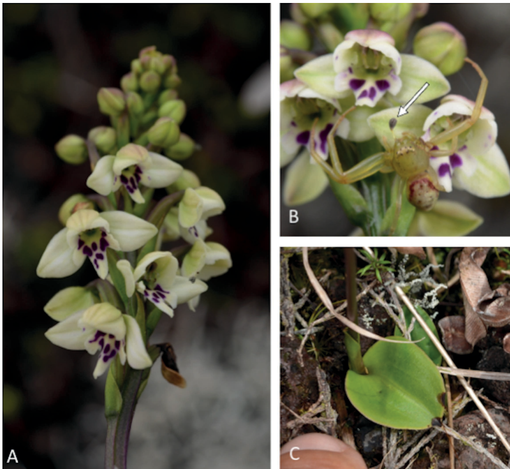
Figure 2 – Cynorkis borbonica . A. Inflorescence fleurie. B. Ledouxia alluaudi portant des pollinies de C. borbonica sur sa tête. C. Feuille.

Statut de conservation – L'estimation de l'AOO et de l'EOO donnent respectivement des valeurs de 12 km 2 et 128