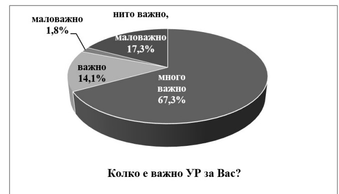
Фигура 4. Значението на УР.

Figure 3. Distribution of survey respondents by municipalities.