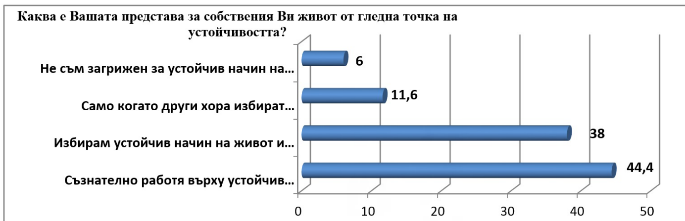
Фигура 5. Устойчив начин на живот.

Изследването прави преглед и на самооценката на хората за това доколко те се възприемат като хора, действащи според идеите на УР. 83% от хората казват, че те живеят съобразно идеите на УР в ежедневието си живот, било то в случаите, когато това струва повече време или средства (пари), или когато това не е толкова скъпо, но отнема много време в сравнение с традиционните възможности. 90% от хората искат да станат по-устойчиви в бъдеще. Това изглежда оптимистичен резултат, но той естествено поражда някои резерви. Първата идва в резултат на релацията с твърдението на много от хората, че ориентирането им към по-устойчив стил на живот не би трябвало да им струва повече време и/или финансови средства. Хората са склонни да се променят, ако това се случва лесно и много