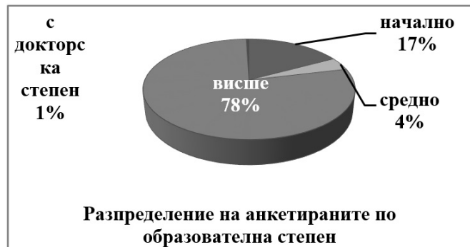
Фигура 2. Разпределение на анкетираните по образователна степен.

Figure 1. Distribution of survey respondents by age.