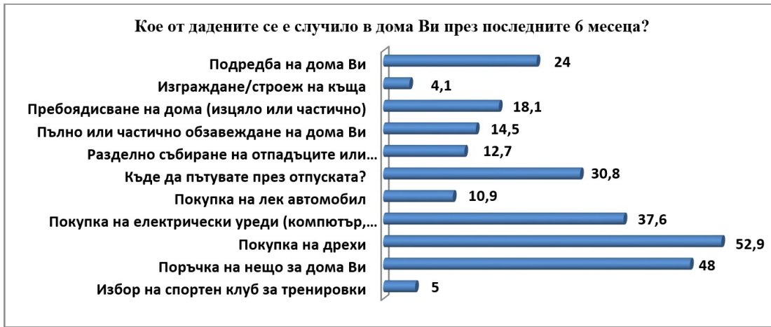
Фигура 6. Дейности в домакинствата през последните шест месеца.