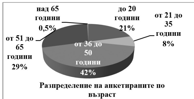
Фигура 1. Разпределение на анкетираните по възраст.

53% от анкетираните са запознати с концепцията за устойчиво развитие (фиг.4). Мъжете са по-запознати с нея, отколкото жените (76% към 73%) и групата на трудоспособното население (20-50 години) демонстрират по-висока информираност, в сравнение с групата над 50 години. Закономерно хората с висше образование са значително по-информирани относно УР, отколкото хората с основно и средно образование.