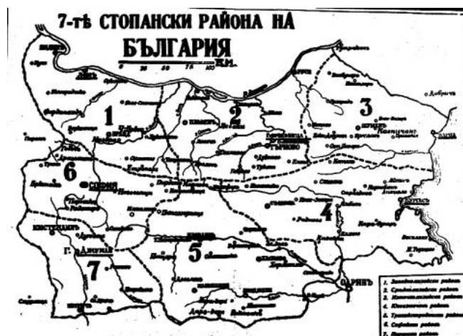
Фигура 1. Стопанскогеографско поделение на България - 1934.

Акад. Бешков има съществени приноси в разработването на важни методологически въпроси от икономическата география и проблеми от стопанската география на България посредством трудовете си Обща стопанска география с обширна въстъпителна физикогеографска и антропогеографска част (1938) и Обща стопанска география с обширна въстъпителна антропогеографска част (1948, Сн. 2). Експертизите на акад. Бешков са резултат от сериозни проучвания и го утвърждават като важен консултант на държавата при вземане на решения за капитални строежи, развитие на инфраструктурата, отраслите и стопанството.