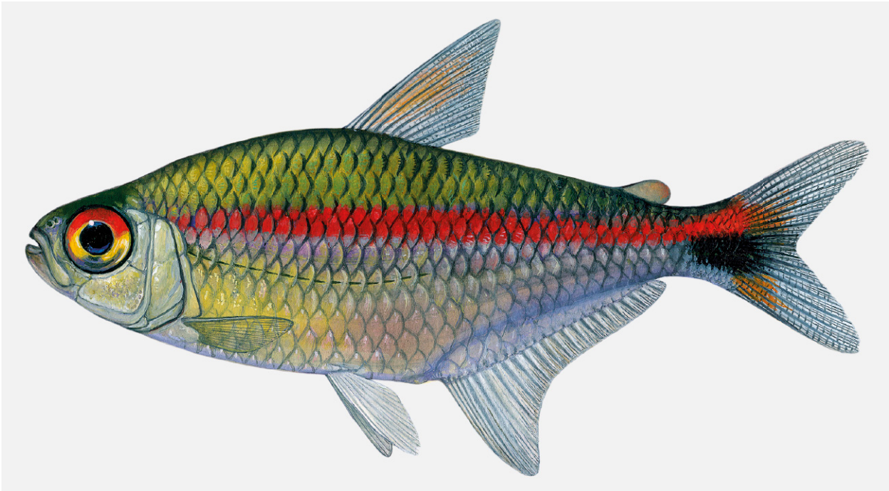
Abb. 5. Hemigrammus rubrostriatus spec. nov., Lebendfärbung, Seitenansicht. Zeichnung: J. SCHOLZ.

deutlich ausgeprägt ist. Ein tiefschwarzer, längsovaler Schwanzwurzelfleck bedeckt den Schwanzstiel und die Basis der Caudale in deren unteren Teilen. Von der Oberkante des Kiemendeckelhinterrandes verläuft eine leuchtend rote, schmale (etwa eine halbe Schuppenbreite starke) Längsbinde über die Körperseite bis zum Schwanzwurzelfleck. Von dort wird sie etwas dorsal abgelenkt, um auf der Basis der Flossenstrahlen der Schwanzflosse zu enden. In dieser roten Zone oberhalb des Schwanzwurzelflecks können irisierende Bereiche vorhanden sein. Unterhalb des Schwanzwurzelflecks eine kräftig weiße Zone. Rückenflosse vorn mit einer schrägen roten Binde. Übrige Flossen farblos.