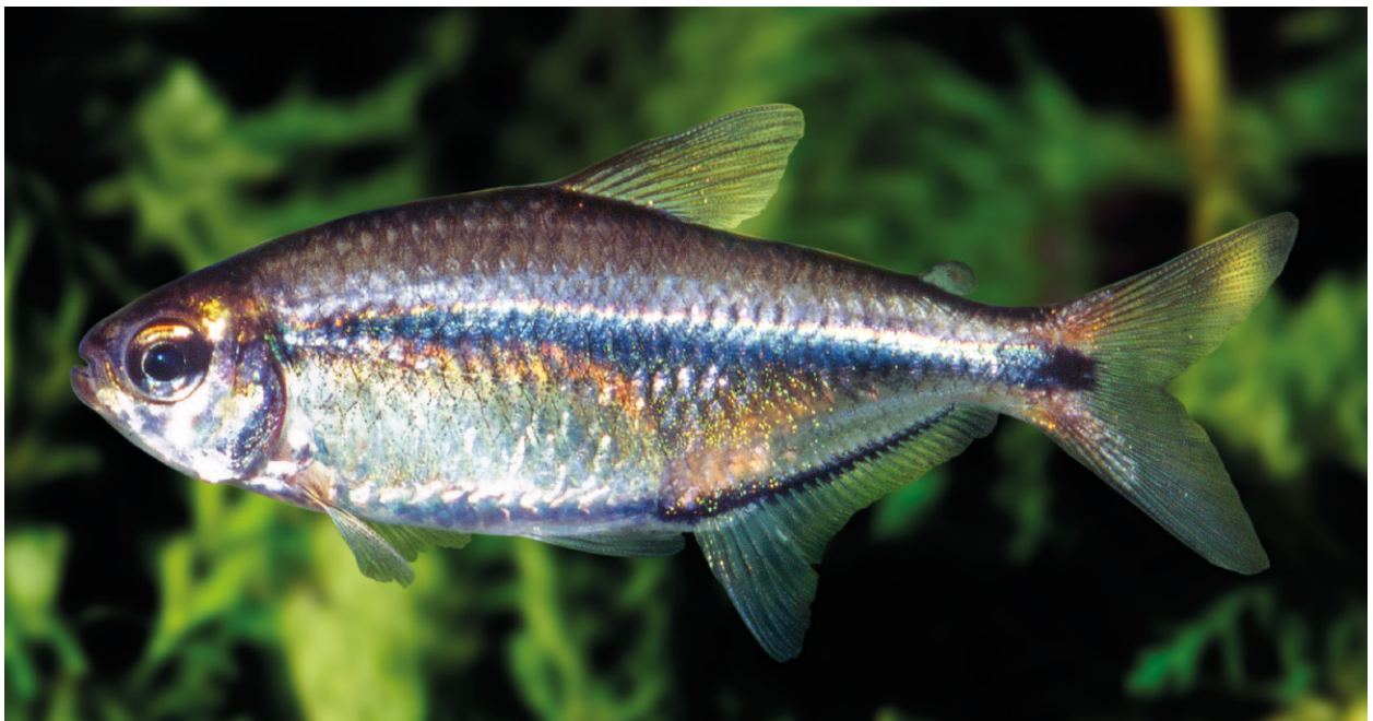
Abb. 7. Hemigrammus barrigonae . Lebendfärbung, Seitenansicht, nicht katalogisiert. Foto: D. BORK.

1914 (Abb. 6) aus dieser Gruppe H. rubrostriatus spec. nov. am nächsten. H. megaceps besitzt aber unter anderem (1) mehr geteilte Flossenstrahlen in der Anale (24 bis 26 vs. 19 bis 21), (2) mehr Schuppen quer über den Körper vor der Dorsale (7/1/6 vs. 6/1/3½ bis 4), und (3) einen größeren Kopf (2,75 bis 3,00 vs. 3,58 bis 4,61 mal in der Körperlänge). In der Färbung gibt es folgende Unterschiede: (1) der Schulterfleck von H. megaceps