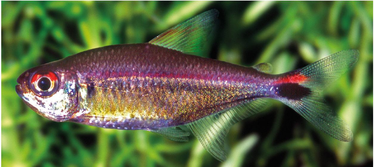
Abb. 3. Hemigrammus rubrostriatus spec. nov., Lebendfärbung, Seitenansicht, Paratypus.