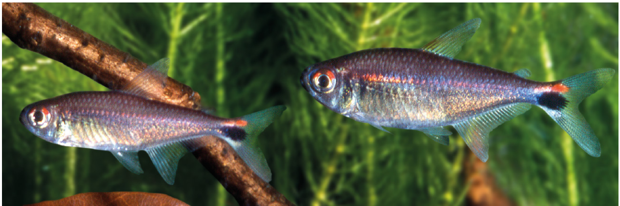
Abb. 4. Hemigrammus rubrostriatus spec. nov., Paar, links Männchen, rechts Weibchen. Lebendfärbung, Seitenansicht, nicht katalogisiert.

16,54 (14 bis 18) vergleichsweise kurze Kiemenreusenzähne auf dem ersten linken Kiemenbogen, auf dem oberen Ast stehen fünf bis sechs, auf dem unteren neun bis zwölf Kiemenreusenzähne.