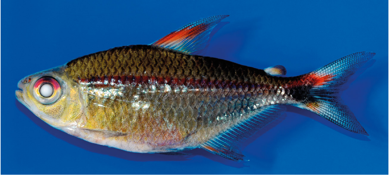
Abb. 1. Hemigrammus rubrostriatus spec. nov., MTD F 33435, Holotypus, 48,6 mm SL, Seitenansicht.