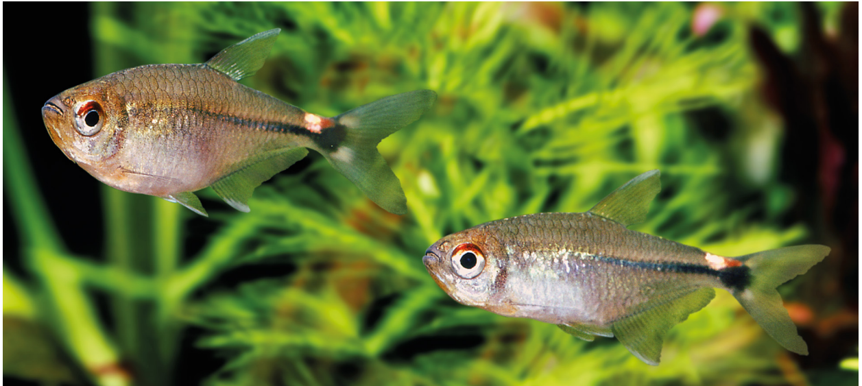
Abb. 8. Hemigrammus falsus MEINKEN, 1958. Lebendfärbung, Seitenansicht, nicht katalogisiert.

lifer is really not that fish. Up to now, we do not know what this is“ (INNES, 1934). 1939 bemerkte dann RACHOW in seiner Bearbeitung der Art für das Standardwerk „Aquarienfische in Wort und Bild“, dass es sich hierbei möglicherweise um eine andere Art handeln könne: „In neuerer Zeit ist die Art wiederholt mitgebracht worden und es ist auch die Meinung entstanden, daß unsere Art nicht mit dem von STEINDACHNER beschriebenen „ Tetragonopterus ocellifer “ identisch sein möge - eine Angelegenheit, die vielleicht mit dem Eintreffen einer ähnlichen Fischart zusammenhängen kann und noch der Klärung bedarf.“