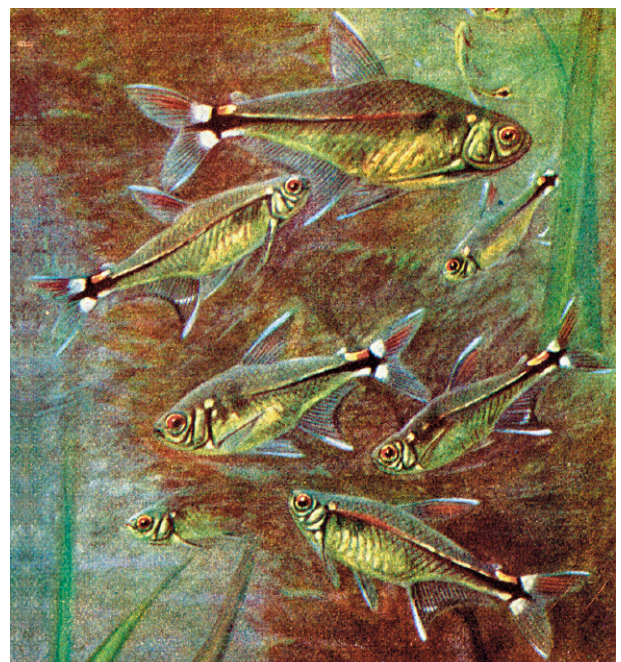
Abb. 9. Hemigrammus falsus MEINKEN, 1958. Lebendfärbung, Seitenansicht. Zeichnung: C. BESSIGER.

1950 wird STOYE dann in Bezug auf die Artzugehörigkeit der 1910 importierten Fische noch genauer: “The first living specimens were imported from the Amazon by the Rossmassler Society of Hamburg in 1910. The same year it was described as Tetragonopterus ocellifer by the editor of Blätter für Aquarien- und Terrarienkunde . A little later the name Hemigrammus ocellifer was used to conform with the latest scientific nomenclature. This attractive little fish was known by this name until the TRUE Hemigrammus ocellifer was brought to New York from, British Guiana in the early 1930’s. The first Head-and-tail-light Fish (which we will call Hemigrammus