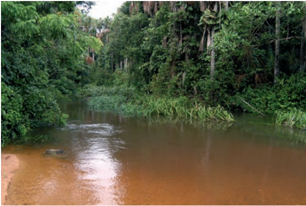
Abb. 7: Igarapé Curuçambá, Habitat von Hemigrammus geisleri sp. n..