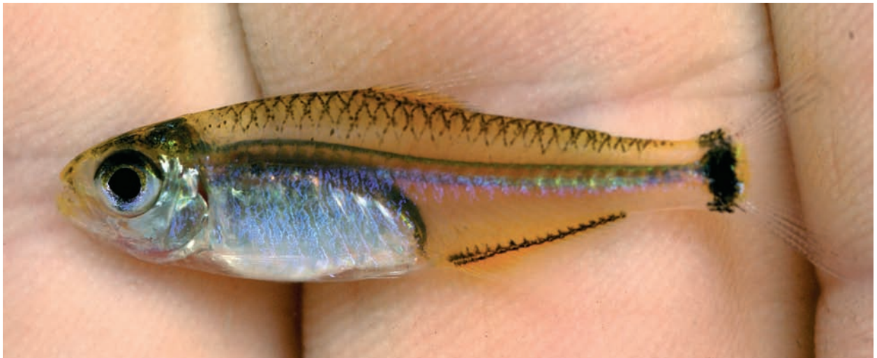
Abb. 6: Hemigrammus geisleri sp. n., Weibchen, Lebendfärbung kurz nach dem Fang, Igarapé Curuçamba.

Geschlechtsunterschiede: Wie bei allen Salmmlern mit durchsichtiger Leibeshöhle ist bei den Männchen der hintere Teil der Schwimmblase sichtbar (Abb. 5). Bei den Weibchen wird der hintere Teil der Schwimmblase teilweise durch das Ovar verdeckt (Abb. 6). Außerdem sind die Männchen von Hemigrammus geisleri sp. n. (1) im Durchschnitt schlanker als die Weibchen (3,74 [3,37–4,08] mal in der SL anstatt 3,43 [3,16–3,87]) und (2) verfügen die Männchen über längere paarige Flossen (Pectoralen und Ventralen) als die Weibchen. So reichen die Pectoralen zurückgelegt bis zum Beginn der Ventralen und die Ventralen erreichen zurückgelegt die Basis des ersten Flossenstrahles der Anale bzw. darüber hinaus. Bei den Weibchen sind die paarigen Flossen kürzer und erreichen nie den Beginn der Basis von Ventrale bzw. Anale. Weiterhin besitzen (3) die Männchen auf den Flossenstrahlen der Anale und Ventrale Häkchen, die den Weibchen fehlen.