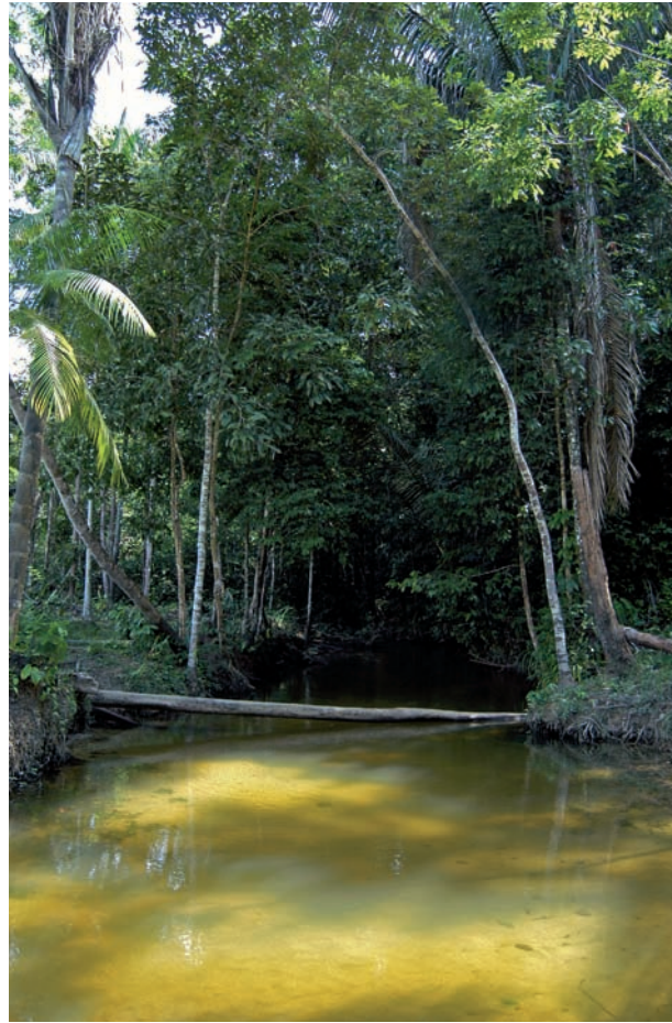
Abb. 9: Igarapé do Boso, Habitat von Hemigrammus geisleri sp. n..

pH-Wert 4,98 (genau wie im Igarapé do Boso); Leitwert 7 \mu\text{S}/\text{cm} ; Sauerstoff 0,88 m/l. Die Fischgemeinschaft bestand aus Vertretern der Gymnotiformes ( Eigenmannia und Brachyhypopomus sp.), Cichlidae ( Apistogramma sp.; Laetacara sp.; Mesonauta sp.; Hypselacara coryphaenoides u.a.) und Loricariidae. Überwiegend waren jedoch Vertreter der Characiformes anzutreffen: Carnegiella strigata ; Bryconops (vermutlich zwei Arten); Hyphessobrycon bentosi (loc. typicus) und zwei weitere noch nicht bestimmte Salmier. GEISLER fing 1967 in diesem Igarapé neben H. geisleri sp. n. folgende Characiformes: Moenkhausia collettii (STEINDACHNER, 1882), M. melogramma EIGENMANN, 1908, M. lepidura (KNER, 1859), Hyphessobrycon bentosi DURBIN, 1908, Axelrodia lindae GÉRY, 1973, Microschemobrycon guaporensis EIGENMANN, 1915, Gnathocharax steindachneri FOWLER, 1914, Iguanodectes purusi (STEINDACHNER, 1875), Myleus sp. (juvenil), Nannostomus marginatus EIGENMANN, 1909, N. trifasciatus STEINDACHNER, 1876, Copella nattereri (STEINDACHNER, 1876), Crenuchus spilurus GÜNTHER, 1864 und verschiedene Characidium sp. und vor allem auch mehrere Exemplare des sympathrischen Hemigrammus mimus BÖHLKE, 1955.