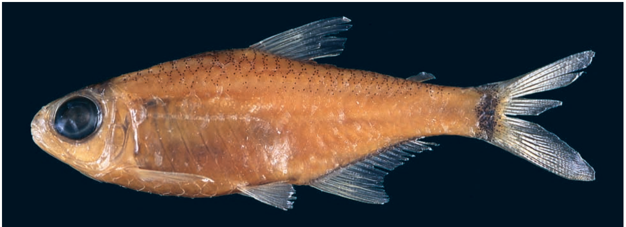
Abb. 2: Hemigrammus geisleri sp. n., Seitenansicht, 31,4 mm SL, Igarapé Curuçamba, Weibchen, Paratypus, MTD F 30614.