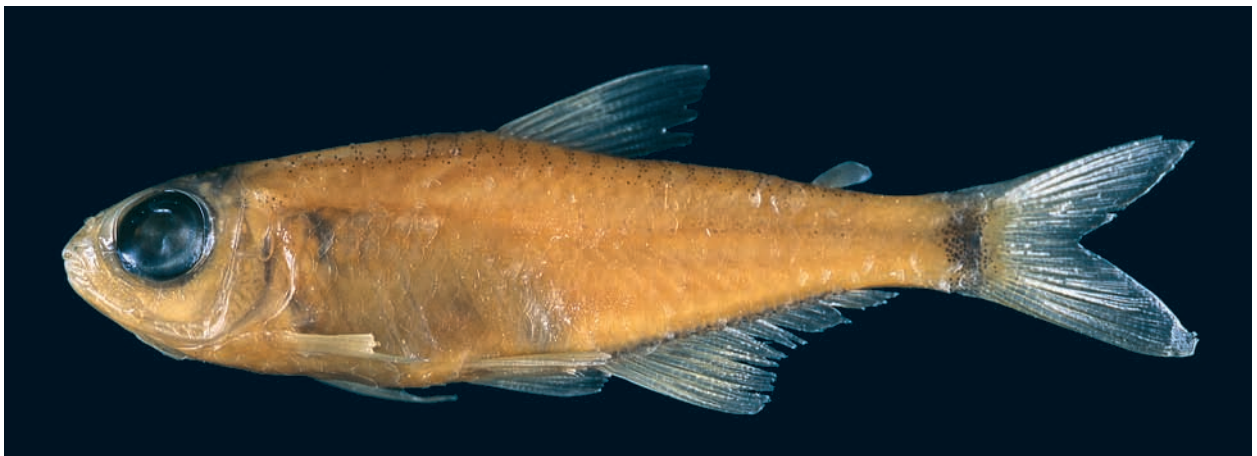
Abb. 3: Hemigrammus geisleri sp. n., Seitenansicht, 27,3 mm SL, Igarapé Curuçamba, Männchen, Paratypus, MTD F 30615.

(selten sechs) fünfspitzige Zähne, (3) Maxillare mit einem bis zwei (selten bis drei) drei- bis fünfspitzigen Zähnen, (4) in der Anale stehen 16–18, meist 17, geteilte Flossenstrahlen, (5) Schuppen längs 29–31, im Durchschnitt 30, (6) acht bis 14, im Durchschnitt 10, durchbohrte Schuppen in der Seitenlinie, (7) 4\frac{1}{3} – 3\frac{1}{2} Schuppen in einer Querreihe vor der Dorsale, (8) 32