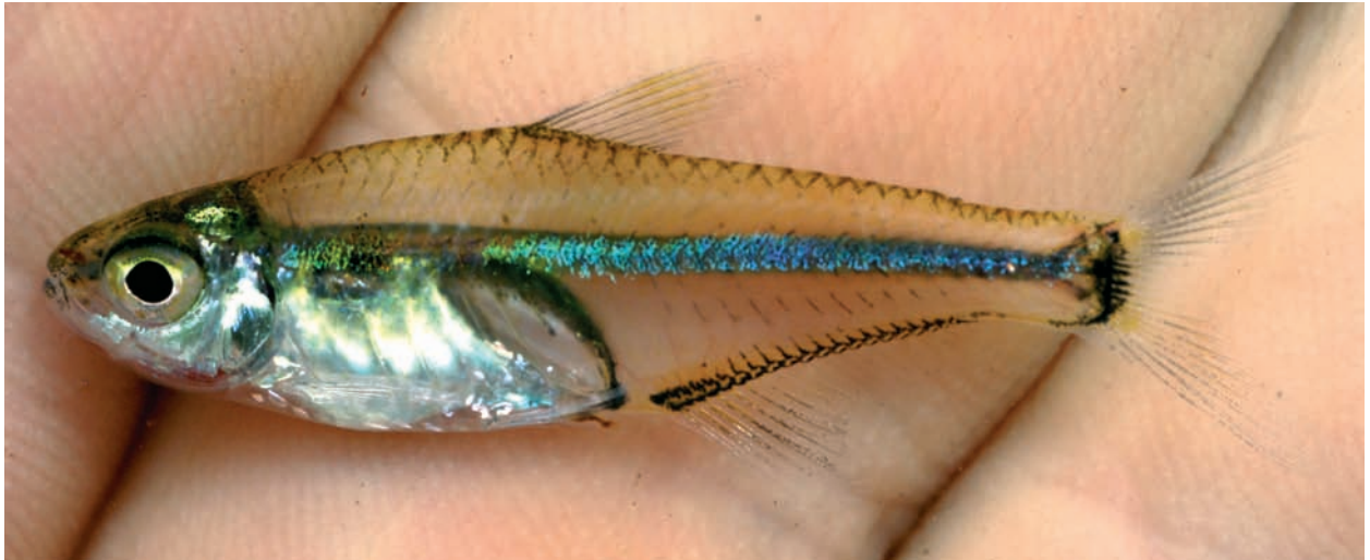
Abb. 5: Hemigrammus geisleri sp. n., Männchen, Lebendfärbung kurz nach dem Fang, Igarapé Curuçamba.