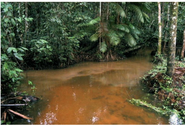
Abb. 8: Igarapé Curuçambá, Habitat von Hemigrammus geisleri sp. n..