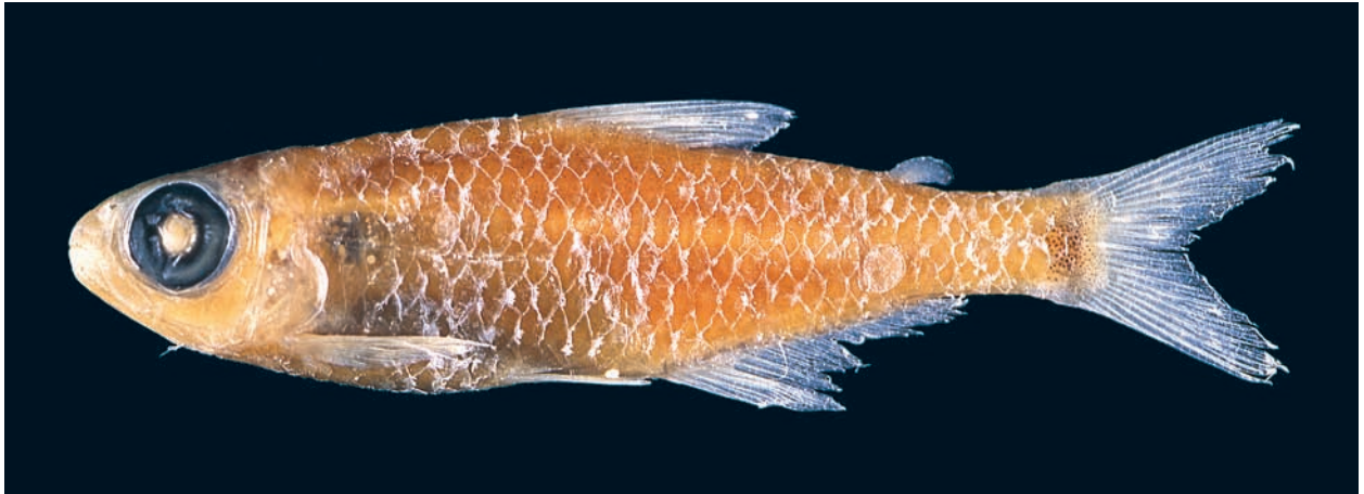
Abb. 1: Hemigrammus geisleri sp. n., Seitenansicht, Holotypus, MTD F 30612.