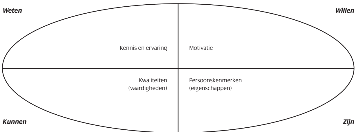
Figuur 1: Factoren die een competentie bepalen

Motivatie heeft alles te maken met willen . Hoe graag wil iemand iets. De motivatie hangt af van de ambitie, (innerlijke) drijfveren en waarden van een individu. Iemand met veel kennis van en vaardigheden voor een bepaalde taak, maar met weinig motivatie voor die taak zal die kennis en vaardigheden niet (snel) inzetten. Er zijn verschillende motieven om te gaan ondernemen. In de literatuur wordt vaak het onderscheid gemaakt in pushfactoren en pullfactoren. Men spreekt van pushfactoren wanneer men, als het ware, het ondernemerschap wordt ingeduwd. Bijvoorbeeld: wanneer iemand werkloos is en daardoor besluit tot het oprichten van een onderneming, omdat er niet direct uitzicht is op een baan. De pushfactor komt dan van buitenaf en zet de persoon aan tot handelen. Andere pushfactoren zijn: gat in de markt ontdekt,