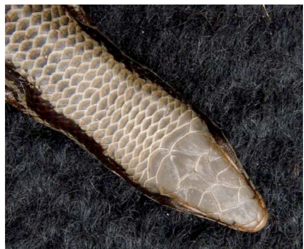
Figure 2. Detail of the head of a Mabuya frenata specimen (MZUFV 467) from the Pico do Ibituruna, Minas Gerais, Brazil. Note the fused frontoparietal scales, characteristic of this species.