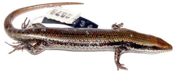
Figure 1. Specimen of Mabuya frenata (MCN-R 2578) from Parque Nacional das Sempre Vivas, Minas Gerais, Brazil.

Our report is based on 51 specimens housed at the following scientific collections: Museu de Zoologia "João Moojen" (MZUFV), Universidade Federal de Viçosa , in Viçosa, Minas Gerais; Laboratório e Museu de Zoologia (LMZ) , Universidade Federal de Alfenas , in Alfenas, Minas Gerais; Laboratório de Zoologia dos Vertebrados (LZV) , Universidade Federal de Ouro Preto , in Ouro Preto, Minas Gerais; Museu de Ciências Naturais (MCN) , Pontifícia Universidade Católica de Minas Gerais , in Belo Horizonte, Minas Gerais; and Museu de Zoologia (MZUSP) , Universidade de São Paulo , in São Paulo, São Paulo.