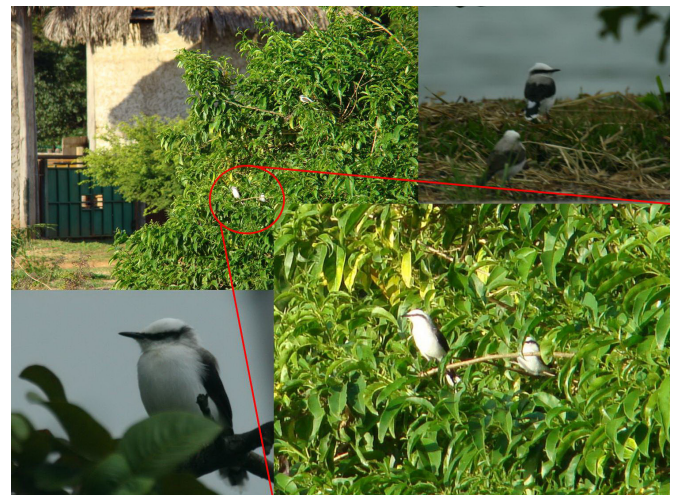
FIGURE 1. Fluvicola nengeta recorded in the Jardim Zoológico de Brasília, Distrito Federal, Brazil.

Over the years, many studies of birds were conducted in the Distrito Federal. However, the presence of F. nengeta was not recorded by any of these studies. For the region, there are records of F. albiventer (Bagno 1998; Bianchi and Bagno 2001; Bagno and Marinho-Filho 2001; Bagno et al. 2005; Bagno and Abreu 2008) and F. pica (Bagno 1996 apud Braz and Cavalcanti 2001). Fluvicola nengeta is originally found in Northeast Brazil (Ridgely and Tudor 2009), and in recent years has expanded its distribution to the North, Southeast and Midwest Brazil. Possibly, the distribution expansion of this species toward Midwest Brazil might be associated with deforestation and fragmentation