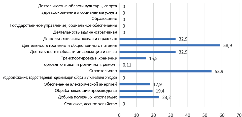
Рис. 1. Доля приезжих, работающих вахтовым методом, в средней списочной численности персонала по видам экономической деятельности, %, 2017 г. Источник: составлено автором по данным Росстата

Источник: составлено автором по данным Росстата