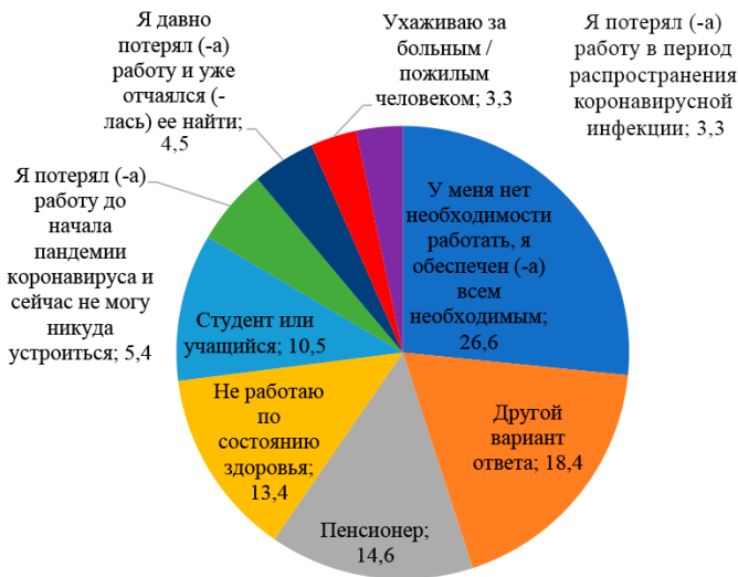
Рис. 2. Распределение неработающих групп респондентов, % от всех ответивших

период распространения коронавирусной инфекции»; «Я давно потерял работу(а) и уже отчаялся (-лась) ее найти»; или другой вариант ответа, то он переходил к анкете для неработающих. На вопросы для неработающих также отвечали пенсионеры, студенты или учащиеся. Среди всех этих четырех групп неработающих были те, кто искал работу за последний год на момент опроса. Для выяснения этого факта был задан дополнительный вопрос: «Занимались ли Вы поиском работы в течение последних 12 месяцев?». В результате в группу неработающих вошли как безработные, занимавшиеся поиском работы последний год на момент опроса, так и неработающие, не относящиеся к рабочей силе, и, которые сами уволились или потеряли работу, но не ищут ее по разным причинам. И безработные, и неработающие, не входящие в рабочую силу, отвечали на вопросы о занятости в прошедшем времени, т.к. нам необходимо было получить информацию о трудовой занятости максимально возможного количества респондентов. Для построения надежных логистических регрессионных моделей также были использованы ответы как безработных, так и неработающих. Таким образом, в статье получилось сравнить особенности трудовой занятости и социально-трудовой мобильности трех основных групп населения Республики Башкортостан: наемных работников, неработающего населения, а также самозанятых и индивидуальных предпринимателей без наемных работников.