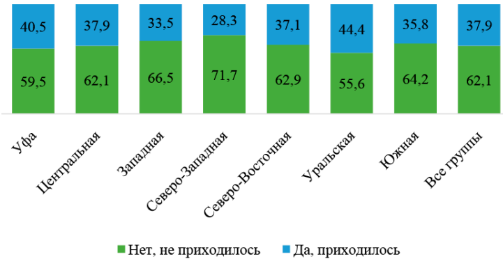
Рис. 5. Ответы на вопрос «Приходилось ли Вам менять место работы в течение последних пяти лет?» в зависимости от социально-экономической зоны Республики Башкортостан, % от всех ответивших

Следует отметить различия в доле местного населения, которые сменили место работы за последние 5 лет, по социально-экономическим зонам Башкортостана (см. рис. 5). Различия хотя и есть, но не такие большие. В Уральской зоне и в г. Уфе чуть больше процент респондентов, менявших место работы за последние 5 лет. В столице это может быть связано с относительно высокой деловой активностью. А в Уральской зоне это, скорее всего, связано с нестабильной социально-экономической ситуацией в районах и городах этой зоны и сложностями с трудоустройством.