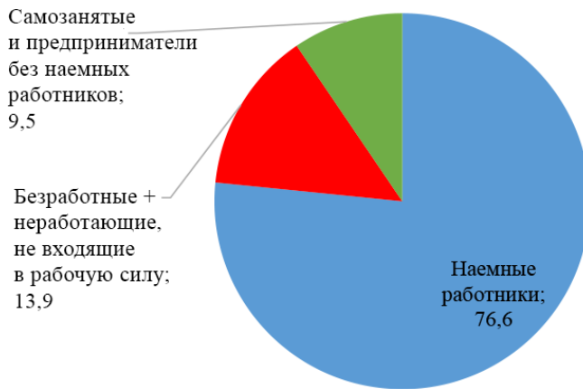
Рис. 1. Распределение респондентов по социально-трудовому статусу, % от всех ответивших

В число наемных работников мы включали тех респондентов, которые трудятся за денежное вознаграждение в организации или на индивидуальное лицо, не имея при этом своих наемных сотрудников. Работа по найму – это работа, при которой лицо заключает явный (письменный или устный) или подразумеваемый трудовой договор, гарантирующий ему базовое вознаграждение (деньгами или натурой), которое напрямую не зависит от дохода единицы, где лицо работает 1 . Соответственно, среди респондентов, которые отвечали на вопросы основной анкеты, наемных работников оказалось 76,6%, у 13,9% респондентов нет работы (безработные и неработающие, не входящие в рабочую силу), и 9,5% – это самозанятые и предприниматели (см. рис. 1). К занятым лицам мы отнесли не только тех, кто работал на момент опроса, но и тех, кто был в декретном отпуске или отпуске по уходу за ребенком до 3 лет, а также в другом оплачиваемом или неоплачиваемом отпуске.