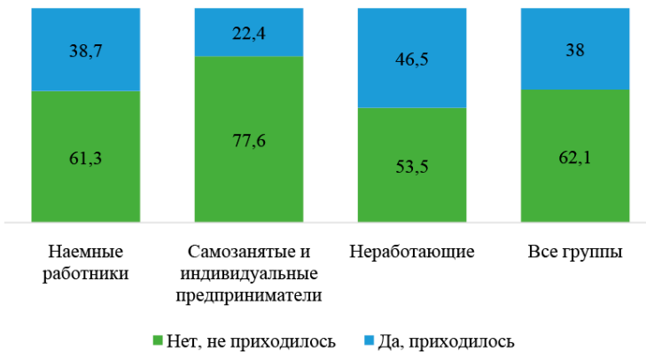
Рис. 4. Ответы на вопрос «Приходилось ли Вам менять место работы в течение последних пяти лет?» в зависимости от социально-трудового статуса, % от всех ответивших

Место работы за последние 5 лет меняли чаще всех неработающие респонденты (см. рис. 4). А самозанятые – реже остальных социально-трудовых групп. Очевидно, что самозанятые сравнительно не часто меняют место работы, т.к. многие из них не имеют дополнительной наемной работы, а трудятся только на себя. Тем более в данном вопросе речь не идет о смене профессии (специализации) или отрасли экономики. Неработающие респонденты занимают самое неустойчивое положение из рассматриваемых в статье групп. Как будет показано ниже, это связано как с индивидуальными мотивами отказа от трудоустройства (нет интереса к работе, неудовлетворенность условиями и оплатой труда, режимом работы и отдыха и т.д.), так и с объективными причинами невозможности трудоустроиться на желаемую работу (отсутствие вакансий, нехватка опыта).