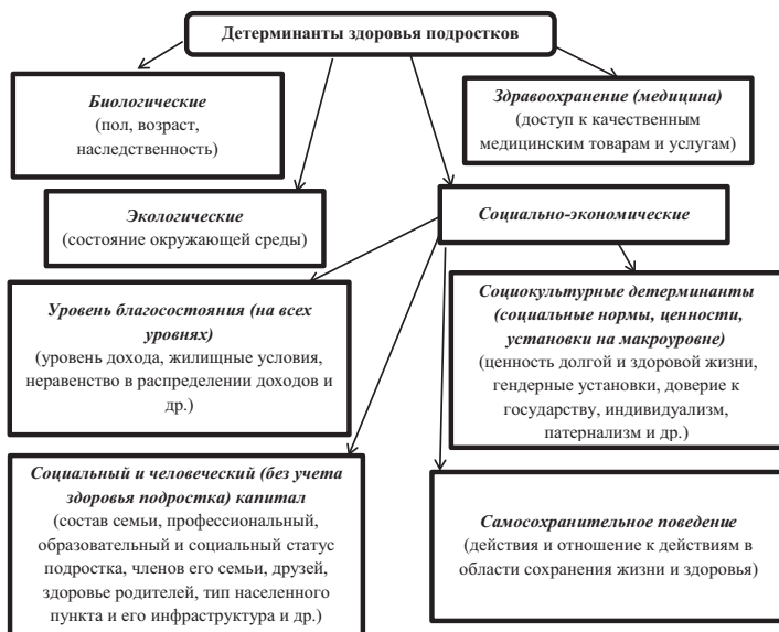
Рис. 1. Классификация детерминант здоровья подростков

Систематизация теоретических исследований и обобщение накопленного российского и зарубежного эмпирического опыта изучения социально-экономических детерминант здоровья были положены в основу классификации детерминант здоровья подростков, используемой в дальнейшем эмпирическом анализе. В рамках четырех наиболее распространенных комплексов детерминант здоровья (здравоохранение, биологические, экологические и социально-экономические детерминанты) автором предложена новая композиция социально-экономических детерминант здоровья, состоящая из следующих блоков: «уровень благосостояния», «социальный и человеческий (без учета здоровья подростка) капитал», «самосохранительное поведение», «социокультурные детерминанты» (рис. 1). Выделен блок социокультурных детерминант макроуровня, таких как ценность долгой и здоровой жизни, гендерные установки, доверие к государству, склонность к индивидуализму, патернализму и др.