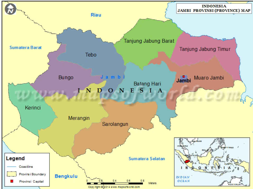
Рисунок 1. Карта провинции Джамби.

доход не соответствует выплатам, которые им полагаются за участие в новой программе, предлагаемой сельской администрацией [Bhattacharyya, 2013]. В работе Sakata & Prideaux [2013] более конкретно подчеркивается, что участие сообщества в развитии не будет эффективным, если оно используется только как гегемонистский инструмент для обеспечения подчинения и контроля со стороны правительства.