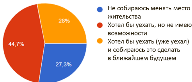
Рисунок 2. Собираетесь ли Вы в ближайшее время менять место жительства?

градской области только 27,3% указали, что не собираются менять место жительства (рис. 2). Желание покинуть родной регион, не имея возможности, выразили 44,7%, а 27,3% опрошенных планируют уехать в ближайшем будущем. Настораживает тот факт, что в подавляющем большинстве желание уехать доминирует даже несмотря на отсутствие опыта проживания в другом городе, что может свидетельствовать о неблагоприятном имидже региона в информационном поле.